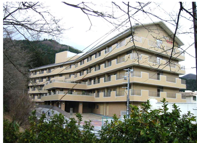
特別養護老人ホーム巴の里